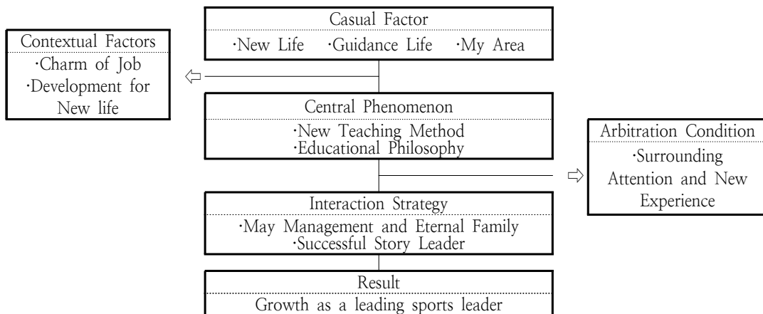
Fig. 3. Exploration of Professional Golfers Growing as Excellent Sports Leaders.

이러한 다양한 측면에서 발생하는 상호작용을 통하여 우수 스포츠지도자로 성장하는 프로골퍼의 삶 탐색의 과정 (Fig. 3)을 알 수 있었다.